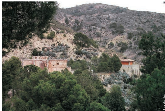
Ermita y refugio de Sant Gaietà