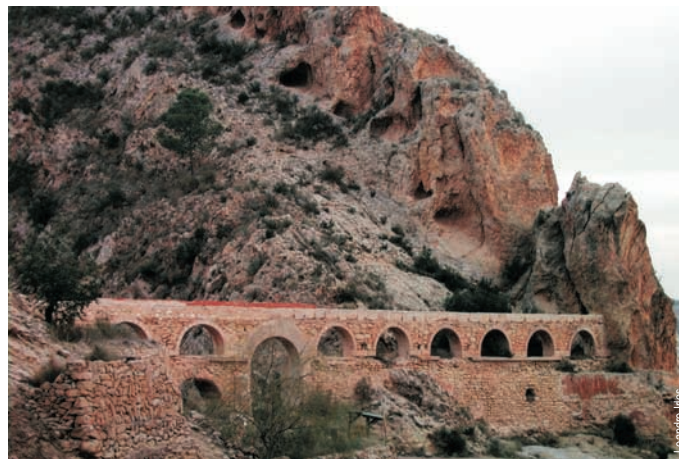
Els Pontets, Crevillente